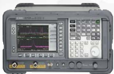
安捷伦频谱分析仪