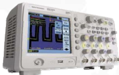
安捷伦高端示波器